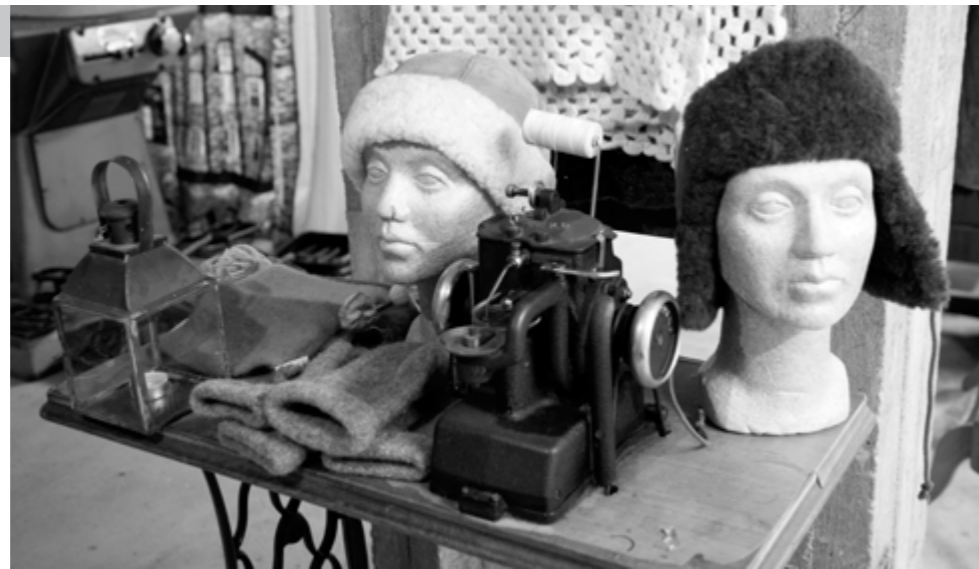
Hannula Shopissa voi tutustua myös koneisiin, joilla tuotteita valmistetaan. Kuvassa ompelukone.

lampaita. Liha on meille sivutuote – tärkeintä ovat kauniit sisustustaljat ja käytännölliset sekä kestävät lammasturkistuotteet.